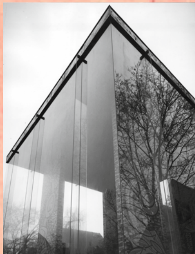
Hängende Verglasung, Bad Orb, 1960