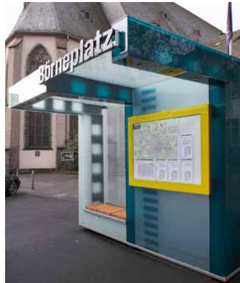
Glasverkleidung und Beleuchtung für ein Buswartehaus-Projekt der Verkehrsgesellschaft Frankfurt am Main

Gemeinsam mit unseren leistungsfähigen Partnern realisieren wir heute den Jahrhunderttraum der Architekten: Konstruktives Bauen mit Glas.