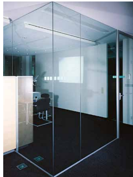
Ganzglaskonstruktion eines Wintergartens in London, 1995, und „gläsernes“ Büro