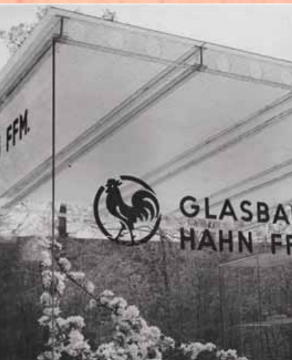
Ganzglaspavillon mit konstruktiven Glaselementen auf der Expo Hannover, 1950