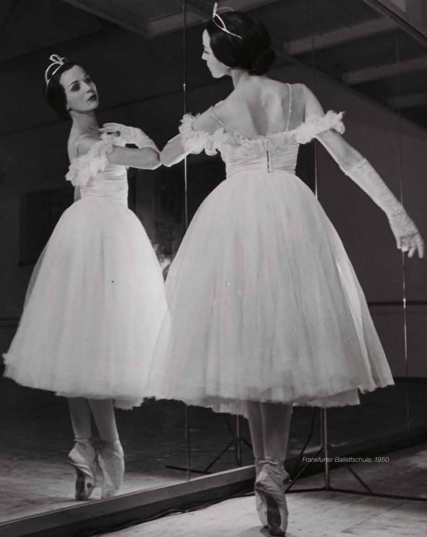
Frankfurter Ballettschule, 1950